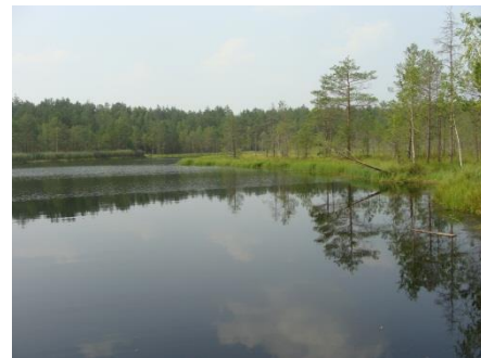
«Озеро Семлевское (Стоячее)»