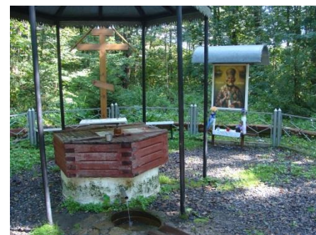
«Святой колодец Николая Чудотворца в д. Луги»

Весной 2016 года при подготовке к международной научно-практической конференции «Усадьбы Смоленщины и Беларуси, их владельцы и обитатели. Музыка. Архитектура. Садово-парковое искусство», которая проходила 5-6 июня 2016 г. проведена огромная работа по обследованию усадебных парков. Работники Дирекции побывали на территории таких уникальных памятников природы как: