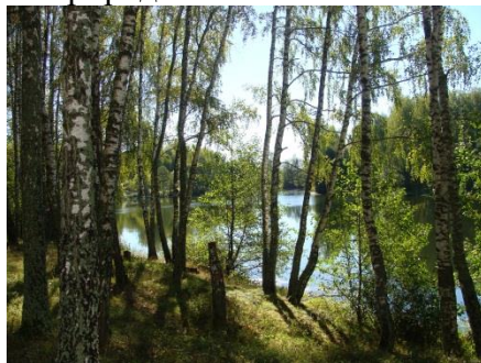
«Березовая роща и пруд у д. Вяхори»