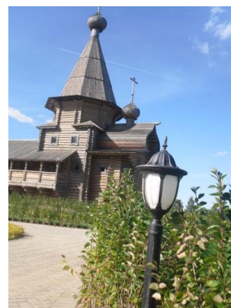
ООПТ регионального значения памятник природы «Исток реки Днепр»

В целях формирования экологической культуры и просвещения населения Смоленской области в период проведения обследования снят научно-публицистический фильм о реке Днепр.